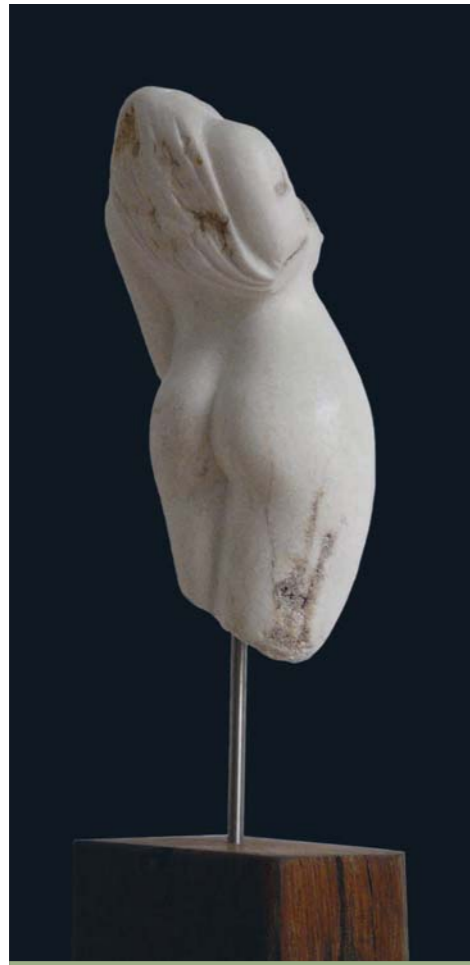
Eva im Schiffchen Steatit, Eichenholz 38,5 cm