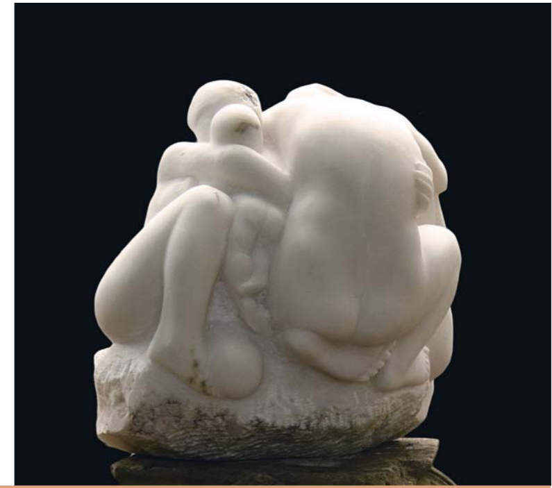
die heilige (Wohn-) Gemeinschaft Alabaster 35 x 20 x 34 cm