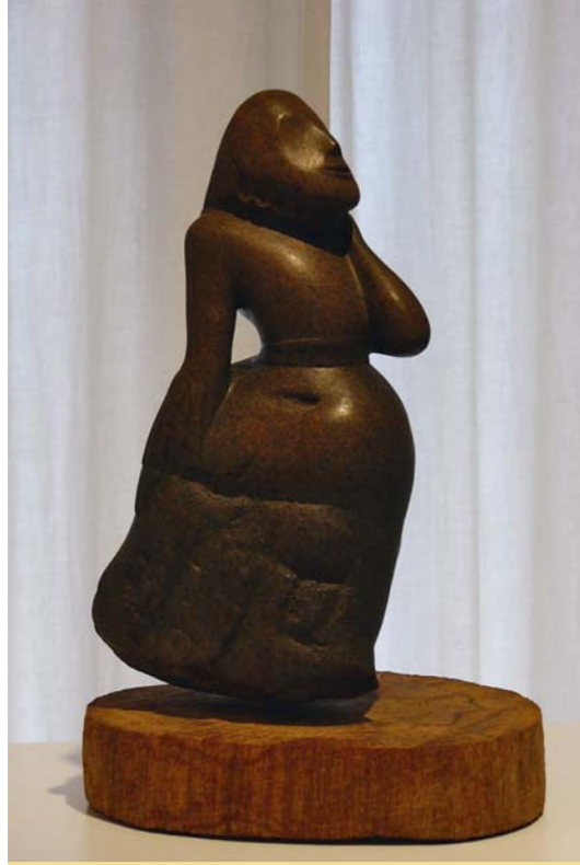
tanzendes Mädchen brauner Serpentin, Eichenholz 33,7 cm