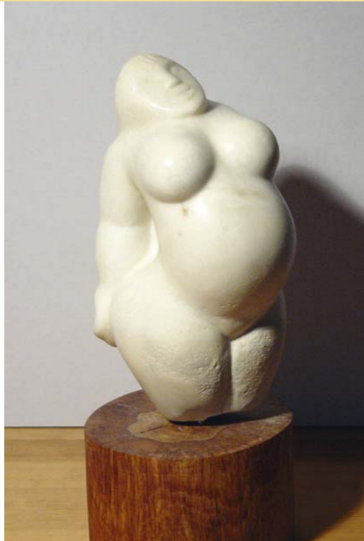
Enuit Steatit, Kirschholz 33 cm