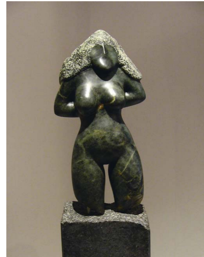
kleiner Torso Steatit, Kirschholz 20,5 cm