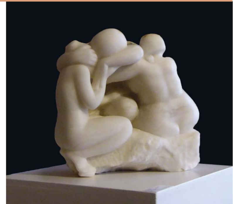
die heilige (Wohn-) Gemeinschaft Alabaster 35 x 20 x 34 cm