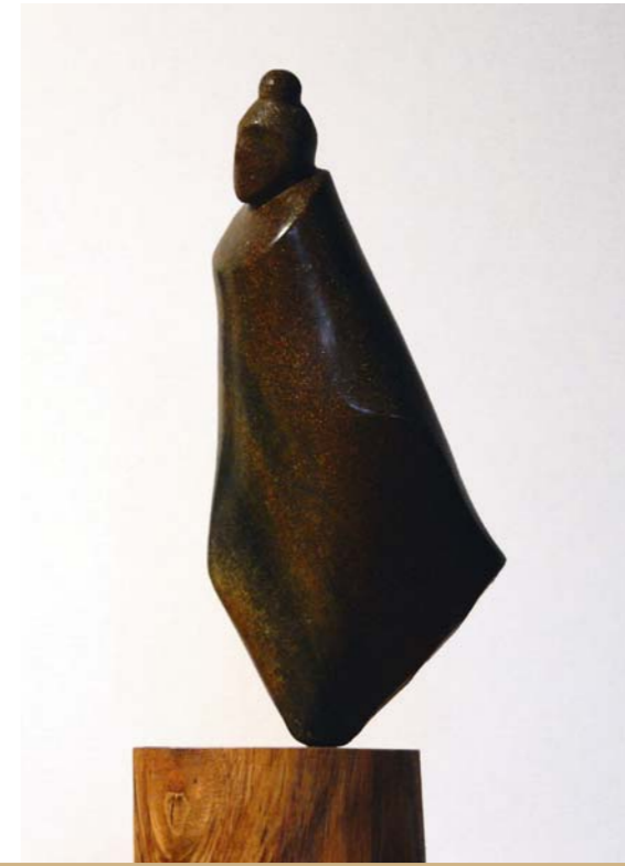
im Kimono Steatit, Kirschholz 23 cm