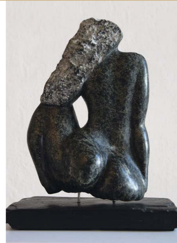
Pythia schwarzer Serpentin, Schiefer 27 cm